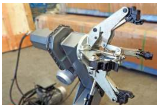
GRIFFE BLOCCAGGIO RUOTA