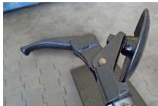
STALLONATORE / UNGHIA